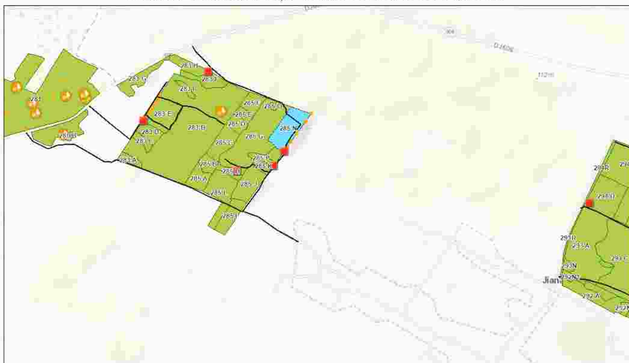
Schita de ansamblu la apv 1700, ua 285N, UP 24 Mehedinti