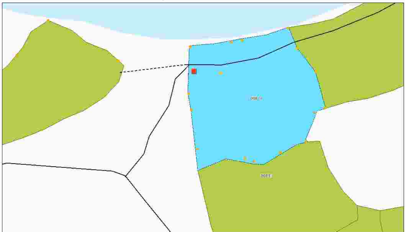
Schita apv 1756,ua8D,UP 37 Filiasi

Proprietar: INGKA INVESTMENTS FOREST ASSETS SRL